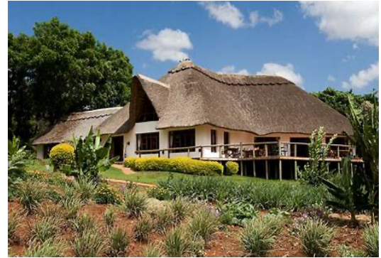
Ngorongoro Farm House