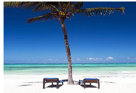
Karafuu Beach Resort hôtel

Séjour libre de 5 nuits à l'hôtel Gold Beach Resort Zanzibar, une chambre double vue jardin en demi-pension ou en all inclusive.