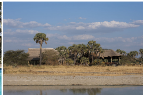
Maramboi Tented Camp