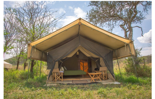
Kuhama Tented Camp