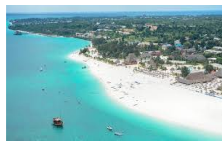
Gold Zanzibar Beach Resort