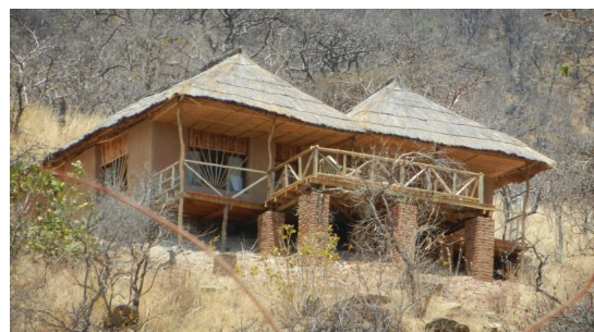
Ruaha Hilltop lodge