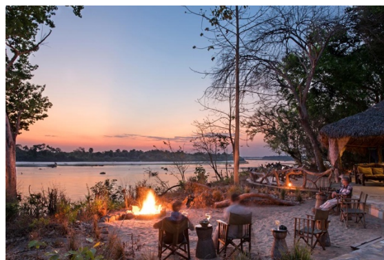
Selous River Camp