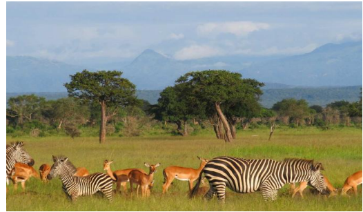
Mikumi Wildlife Camp